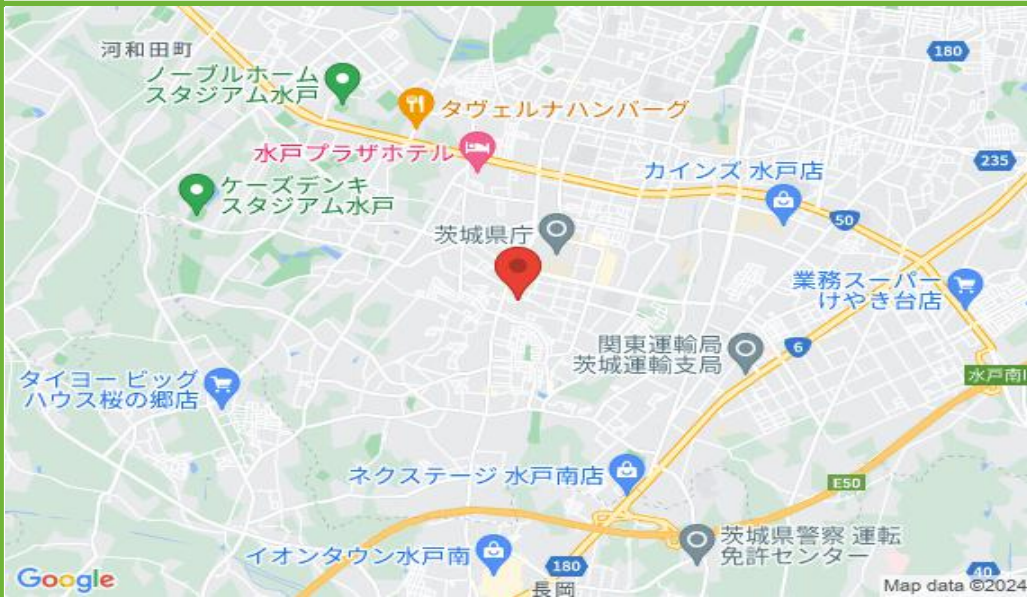
ワイシー水戸笠原町駐車場配置図