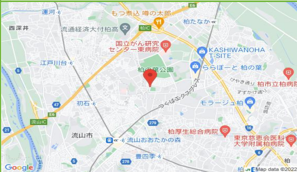
柏の葉駐車場 配置図

保管場所承諾証 保管場所承諾証が必要な場合は発行手数料といたしまして1台につき2,000円の手数料がかかります。