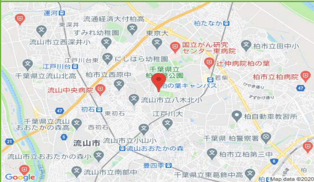
柏の葉駐車場 配置図

この物件の詳細は https://www.katsurafudosan.jp/search/parking_details_22