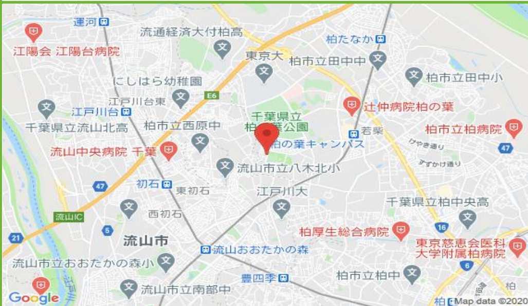
柏の葉駐車場 配置図