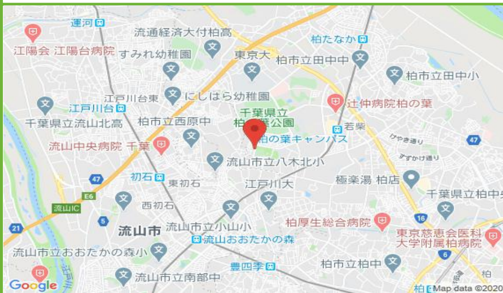
柏の葉駐車場 配置図