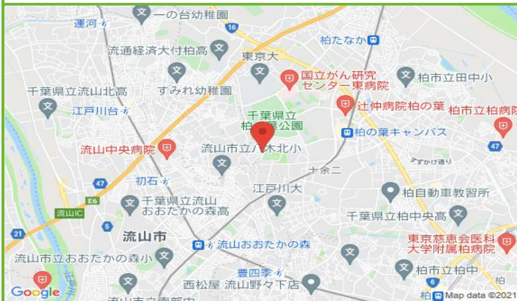
柏の葉駐車場 配置図