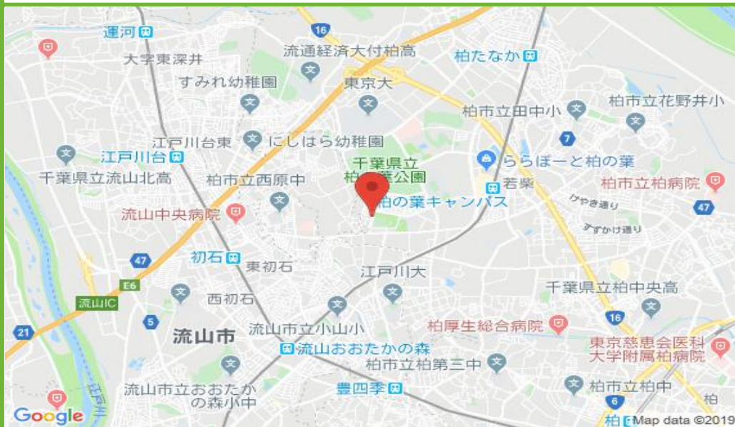
柏の葉駐車場 配置図