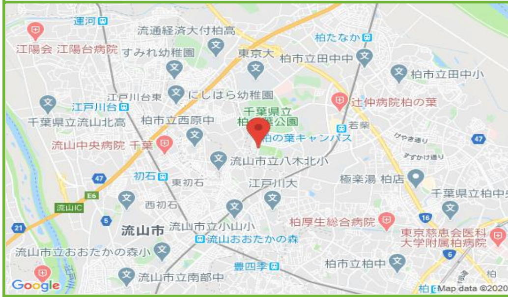
柏の葉駐車場 配置図

この物件の詳細は https://www.katsurafudosan.jp/search/parking_details_22