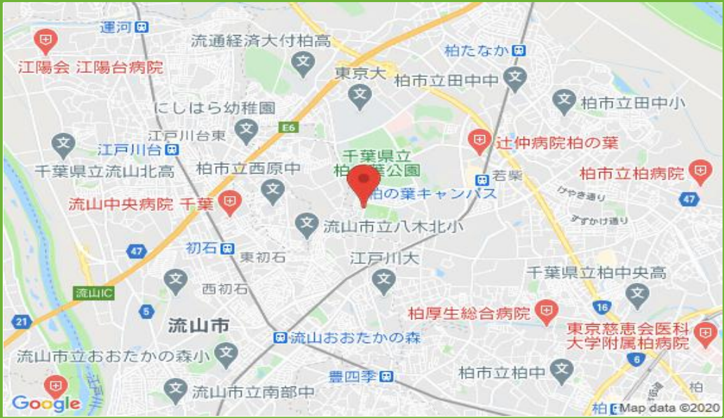
柏の葉駐車場 配置図

この物件の詳細は https://www.katsurafudosan.jp/search/parking_details_22