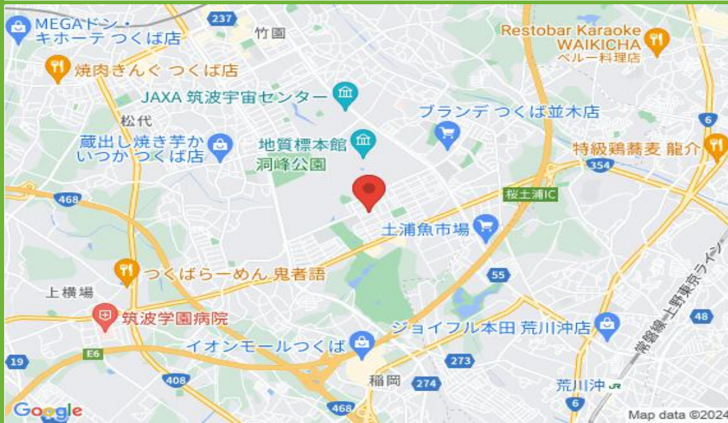
ダイロク駐車場配置図